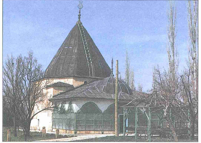
Abdal Müsâ Tekkesi

Tekkenin inşa edildiği tarihte ne gibi mimarî özelliklere sahip olduğu kesin-